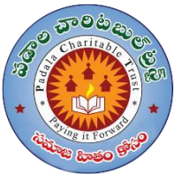
Padala Charitable Trust