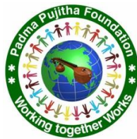
Padma Pujitha Foundation